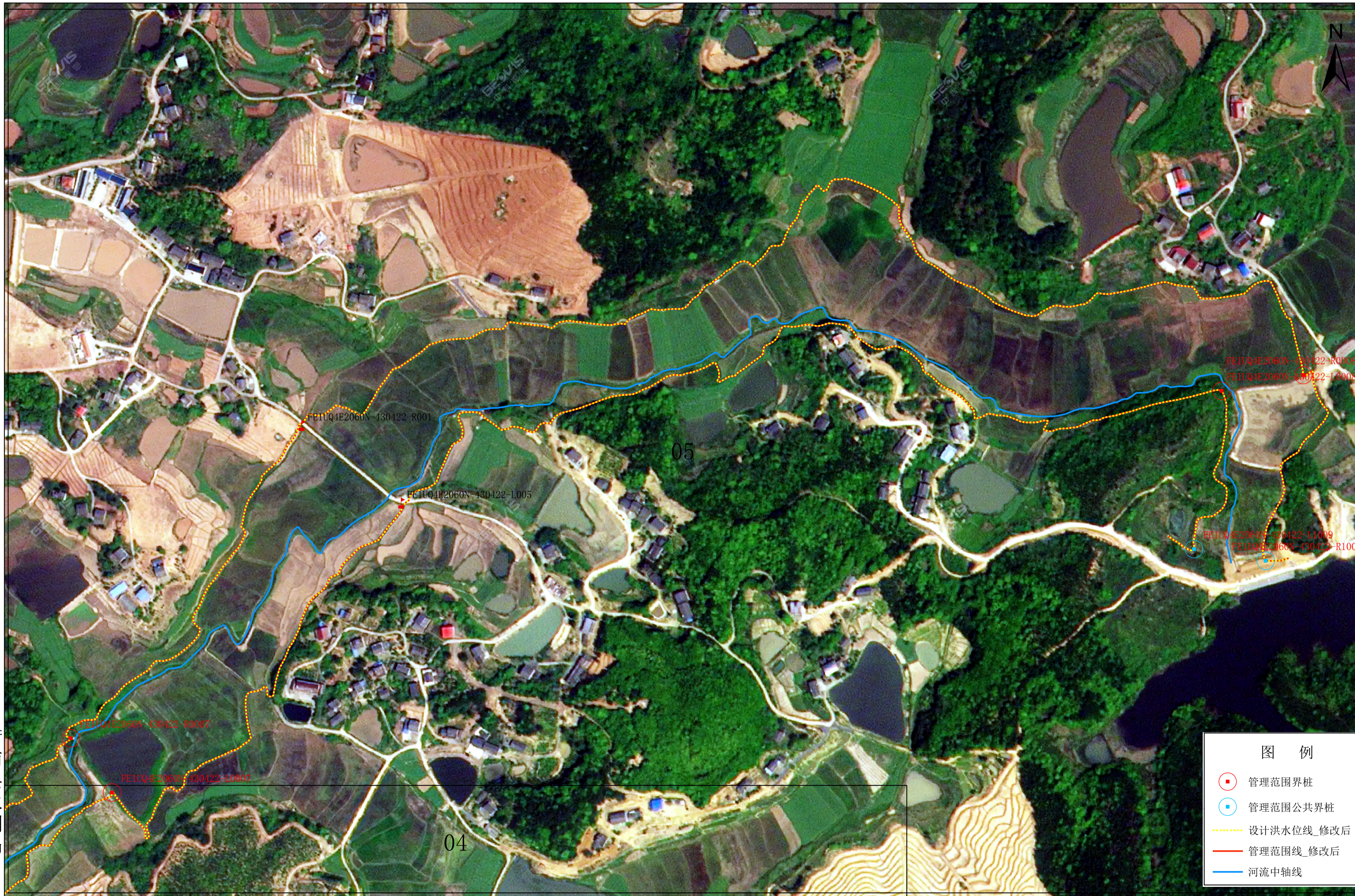
太平桥衡南县河段管理范围划定图5-5