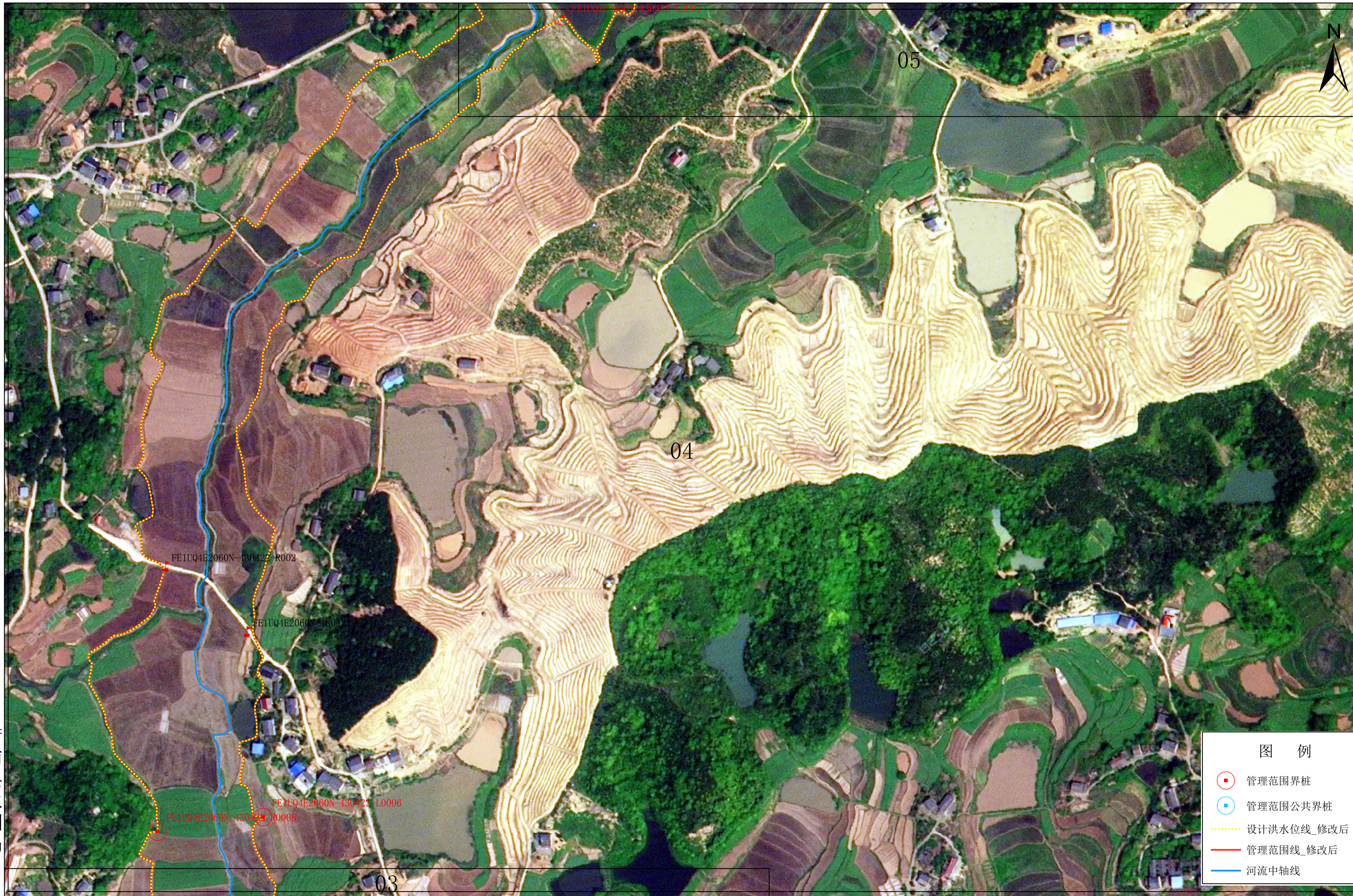
太平桥衡南县河段管理范围划定图5-4