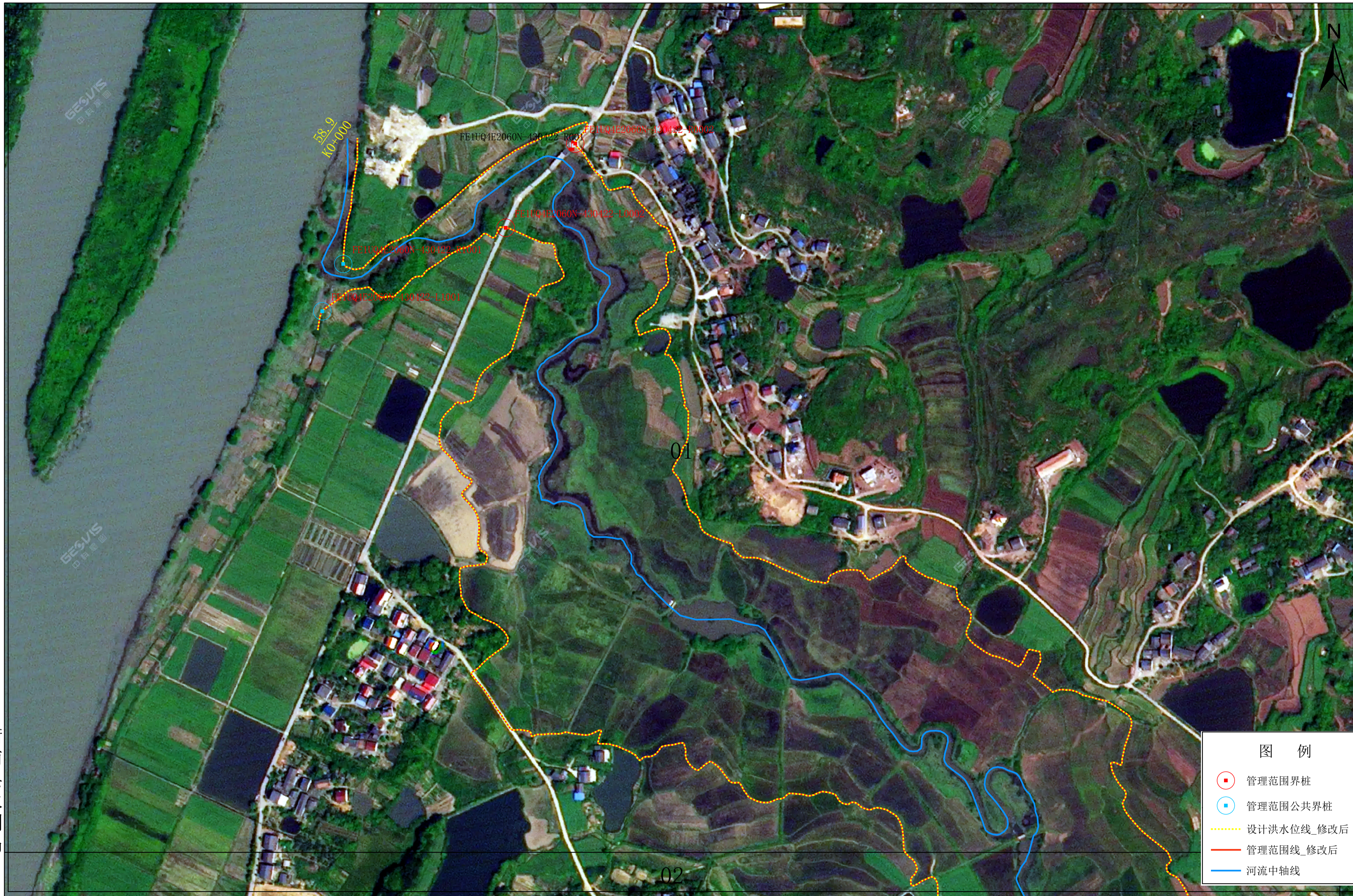
太平桥衡南县河段管理范围划定图5-1